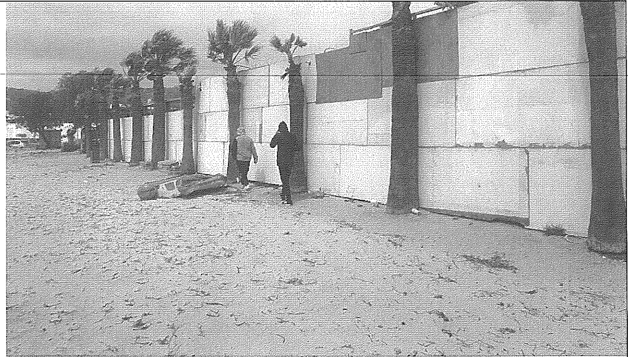
Ξύλινο προπέτασμα κατά μήκος της πρόσοψης του καταστήματος (κατ. 5)