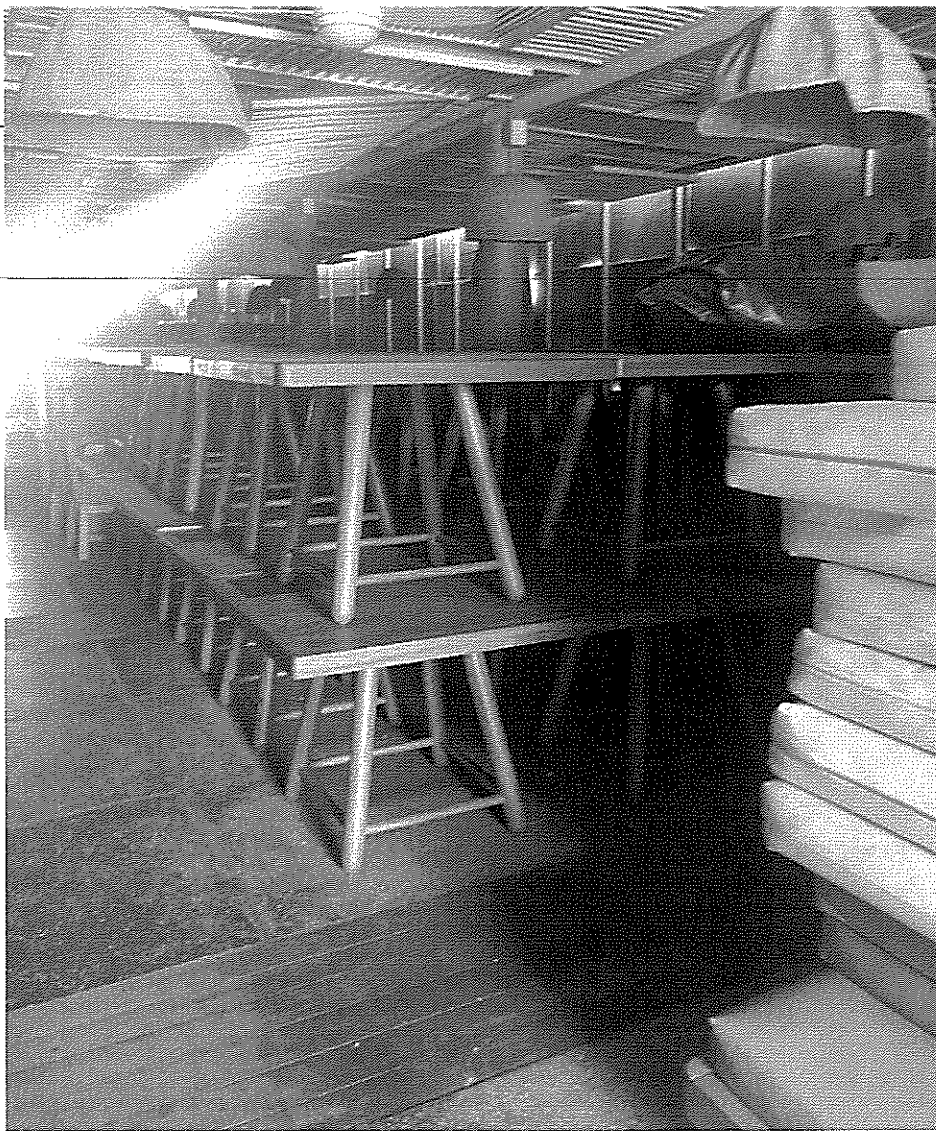
Άποψη του χώρου μπροστά από το bar, στο χώρο της πέργκολας και των ξύλινων πάνελ (κατ. 5)