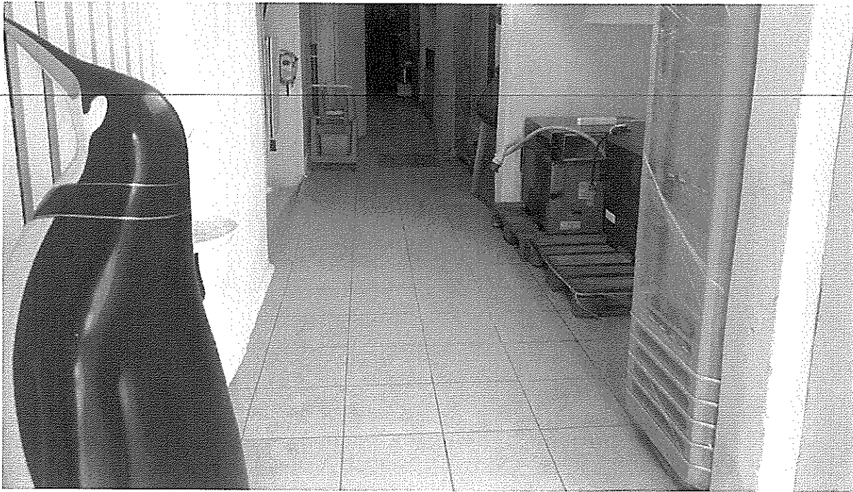
Άποψη των κλειστών βοηθητικών χώρων αυθ. κατασκευή με αρ. (1), (2)