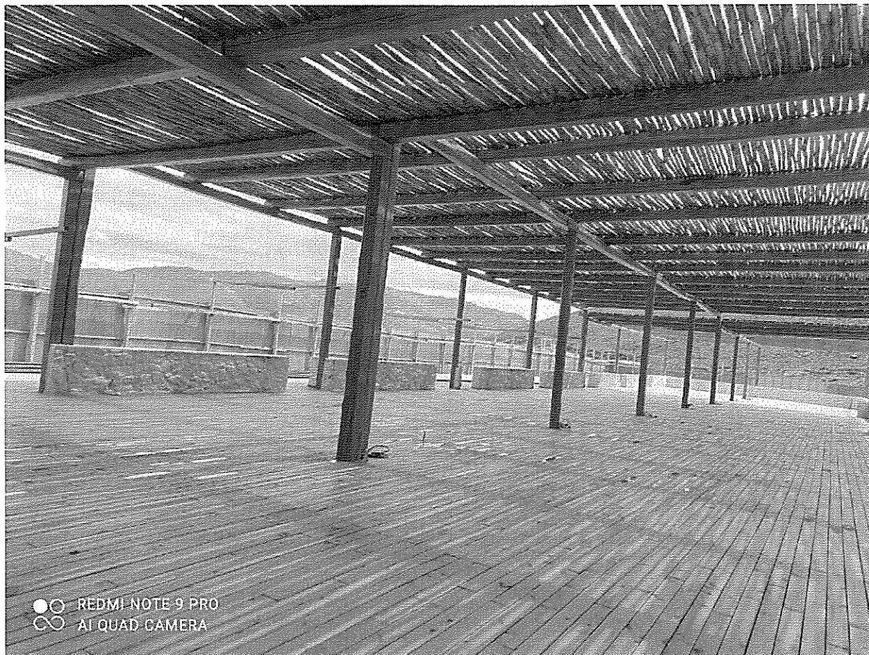
Γενική άποψη από πέργκολες και ξύλινου περιφράγματος παραλίας