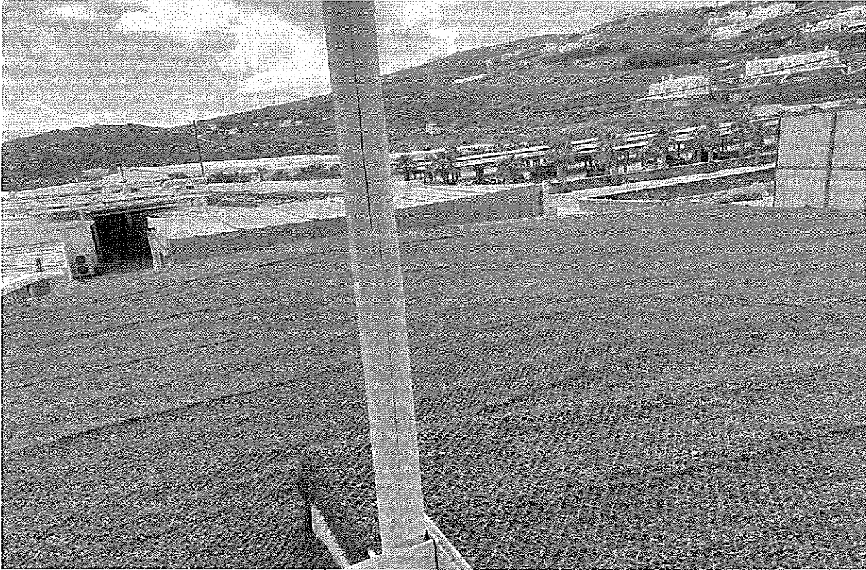
Άποψη κλειστού χώρου στο βόρειο τμήμα του ακινήτου – διακρίνονται οι χώροι στάθμευσης