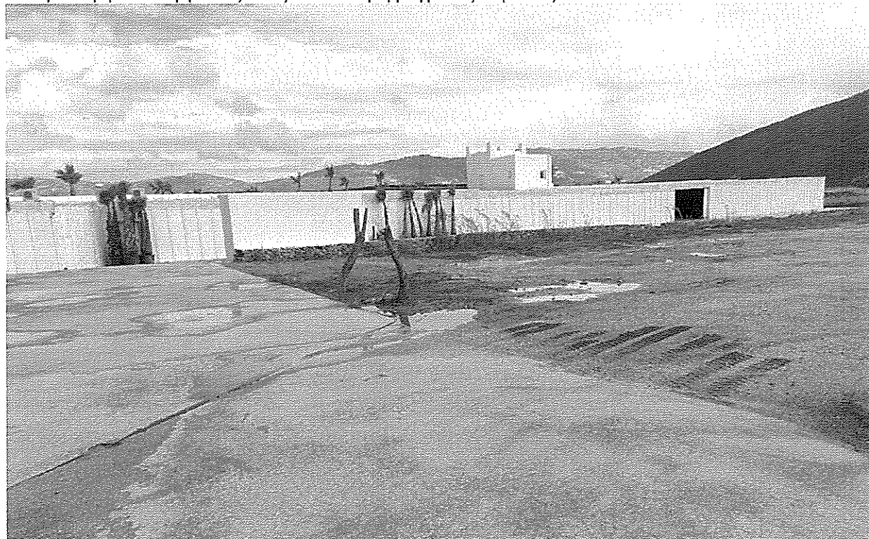
Γενική άποψη κατασκευής στο νότιο τμήμα του ακινήτου δίπλα στο προστατευόμενο ρέμα