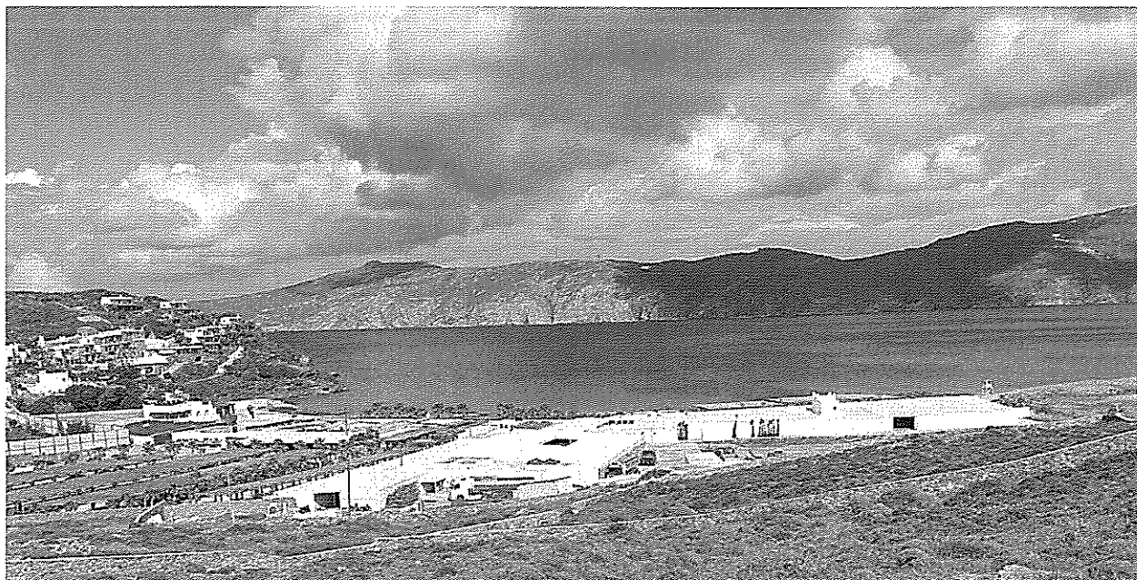
Γενική άποψη ακινήτου

φωτογραφίες των περιγραφόμενων αυθαιρεσιών και του ακινήτου