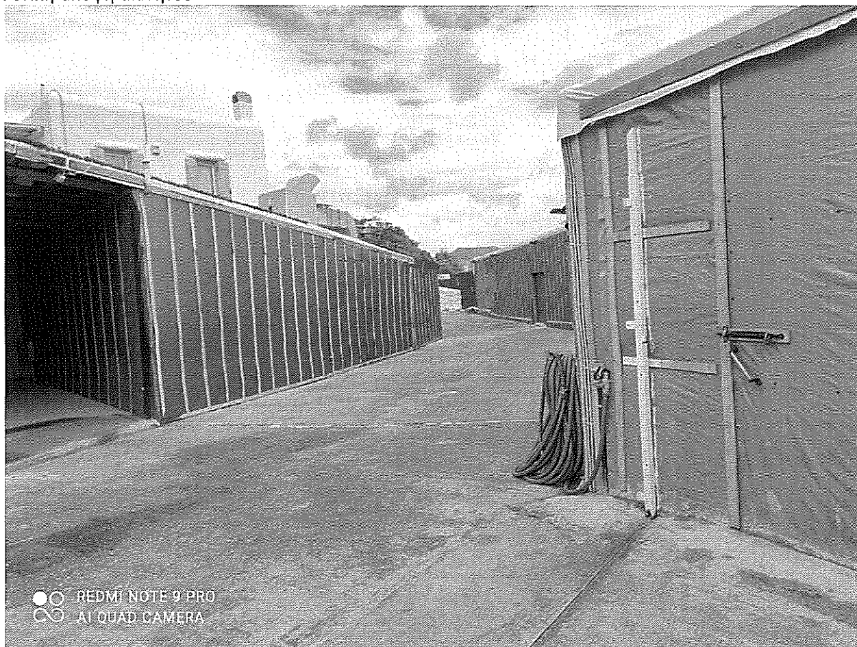
Αυθαιρέτες κατασκευές στο βόρειο τμήμα του ακινήτου