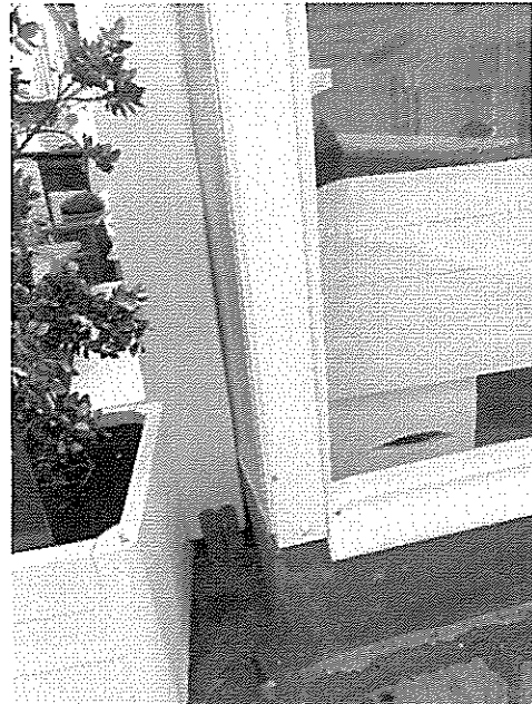
Φωτ.2 (λήψη 11/04/2023)