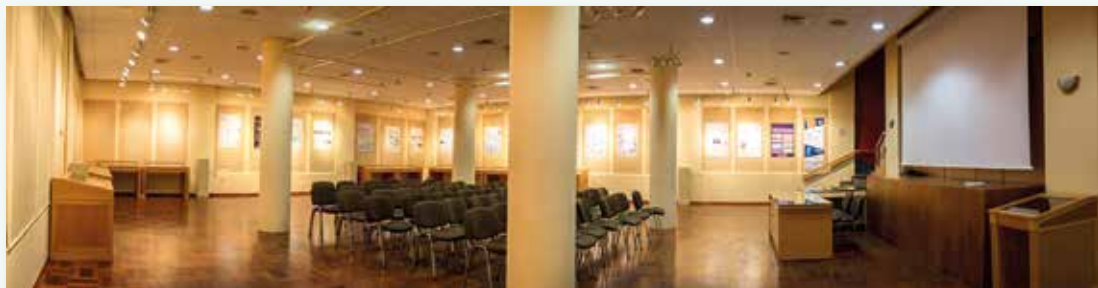
Οι αίθουσες Λόγου και Τέχνης όπου πραγματοποιούνται τα μαθήματα